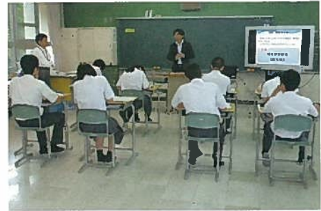
布野中学校租税教室