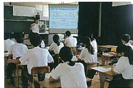
君田中学校租税教室